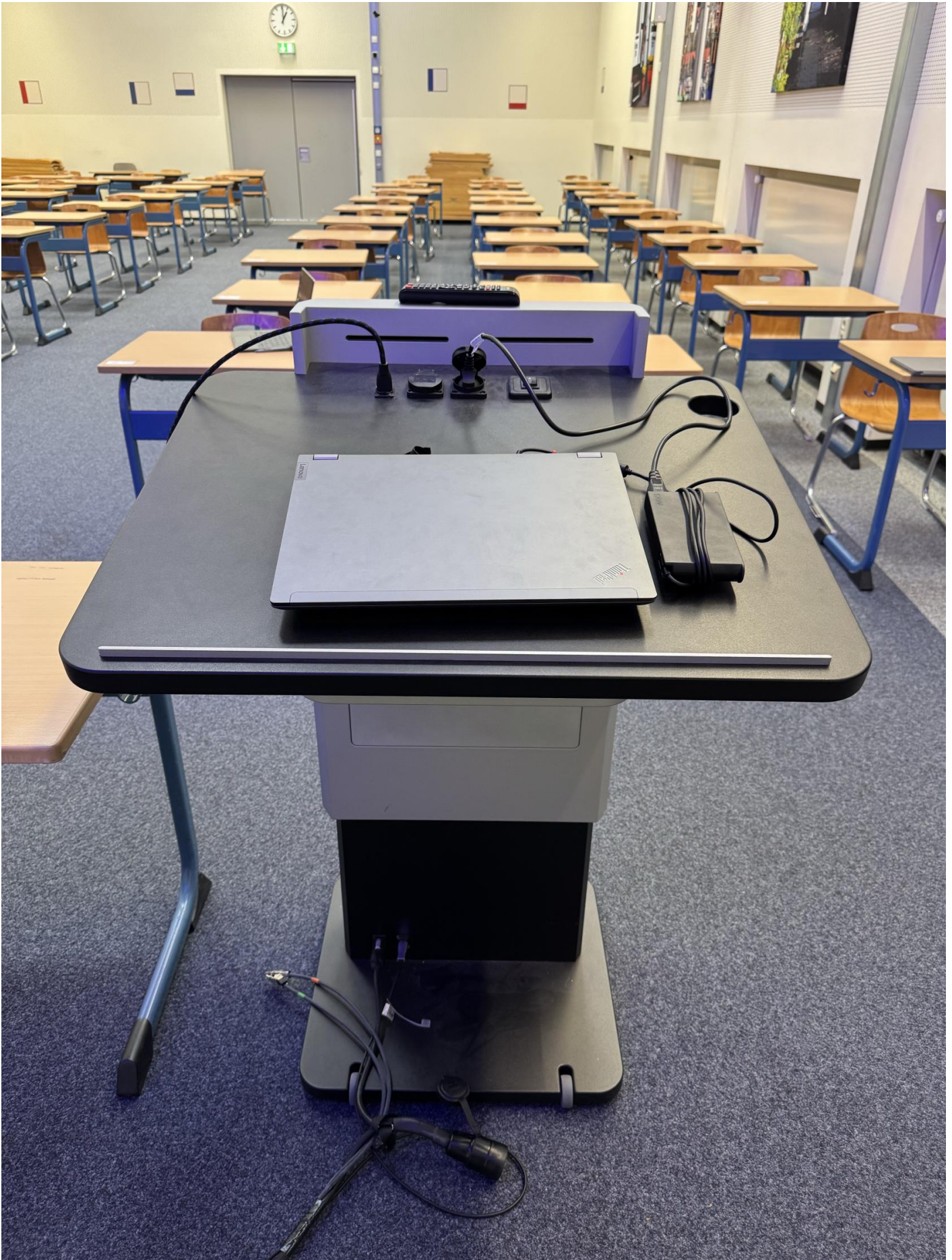
Auf dem Pult befinden HDMI Kabel, Steckdose und der Knopf für die Höhenverstellung des Pults.